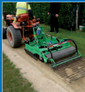
Désherbage mécanique des allées sablées