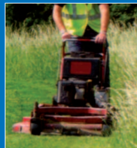
Gestion différenciée et prairies fleuries