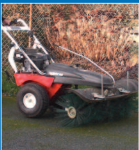
Balayage préventif de la voirie

En retour, le SMAP conseille les communes sur le désherbage alternatif et organise des journées d'information et de démonstration de matériel pour les élus et les agents. Le SMAP propose aux communes et communautés de communes de tester et d'appliquer des techniques qui sont indispensables pour atteindre le Zéro Phyto :