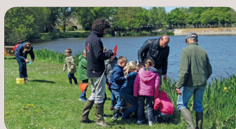
École de Saint-Lormel