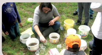
École de Saint-Jacut du Mené