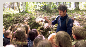
École de Plélan-le-Petit