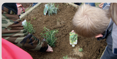
École de Plénée-Jugon