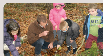
École de Broons