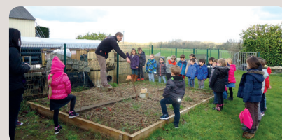
École de Mégrit