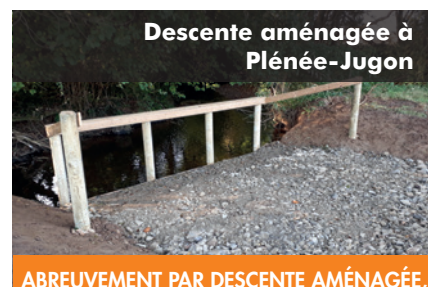
Descente aménagée à Plénée-Jugon