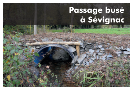
Passage busé à Sévigné

Restauration et équipements d'abreuvements directs au cours d'eau