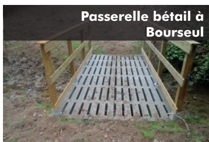
Passerelle bétail à Bourseul