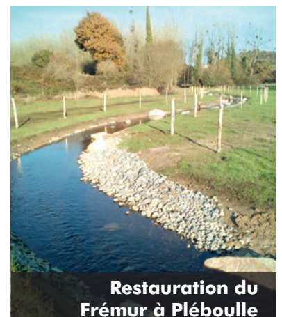
Restauration du Frémur à Pléboulle